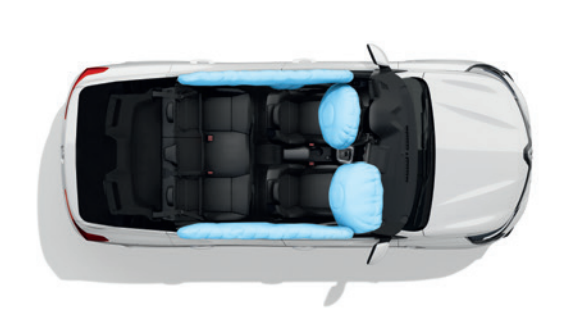
4 Airbags (Front and Side) ع وسائد هوائية (أمامية - جانبية)