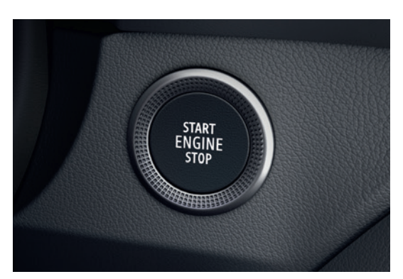
Keyless Engine Start/Stop نظام تشغيل المحرك بدون مفتاح