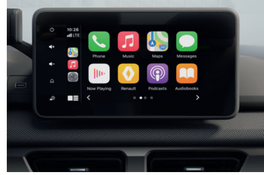
Apple CarPlay & Android Auto Support تدعيم أنظمة هواتف أبل وأندرويد