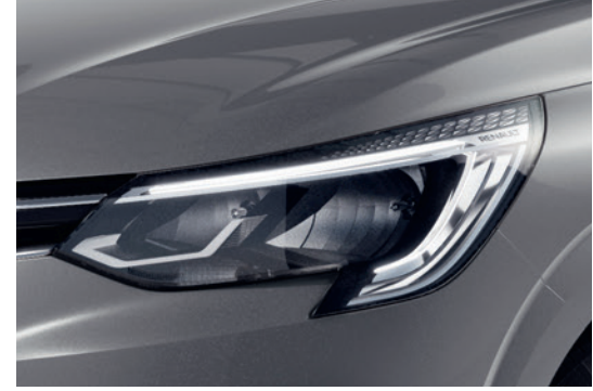
C-Shape LED Daytime Running Light إضاءة نهارية LED تعمل عند تشغيل المحرك