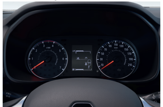
4.2" Digital Cluster Screen شاشة عدادات ديجيتال ۲/۶ بوصة