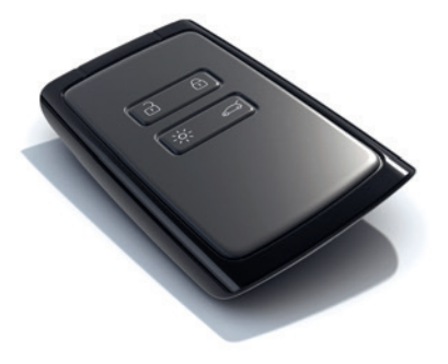
Keyless Entry System (Renault Smart Card) (کارت رینو الذکی) نظام دخول السیارة بدون مفتاح