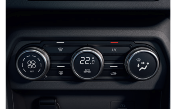
Automatic A/C تكييف هواء أوتوماتيكي