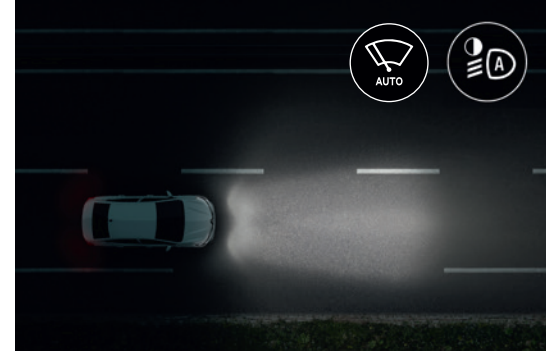
Automatic Light & Rain Sensors التشغيل التلقائي للمصابيح والمساحات