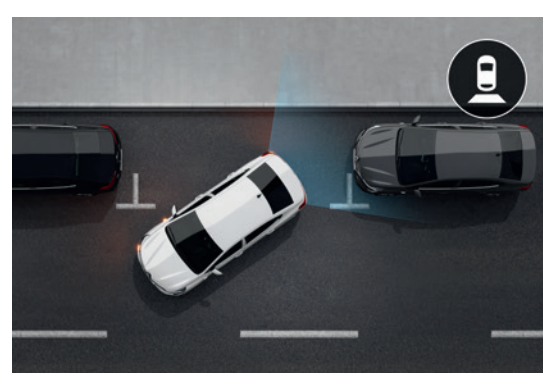
Rearview Camera کامیرا خلفیة