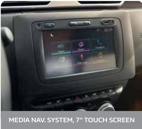
MEDIA NAV. SYSTEM, 7" TOUCH SCREEN