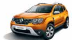
ATACAMA ORANGE (EPY)