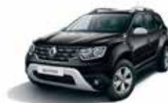
PEARL BLACK (676)