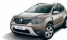
DUNE BEIGE (HNP)