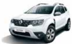
GLACIER WHITE (369)