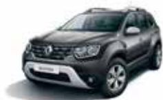
COMET GREY (KNA)