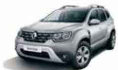
MERCURY GREY (D69)