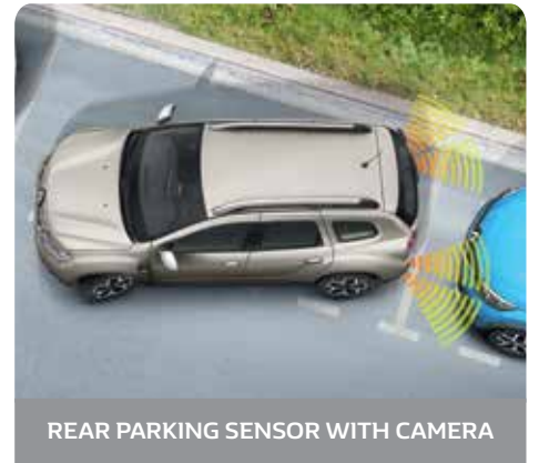
REAR PARKING SENSOR WITH CAMERA