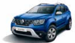
COSMOS BLUE (RPR)