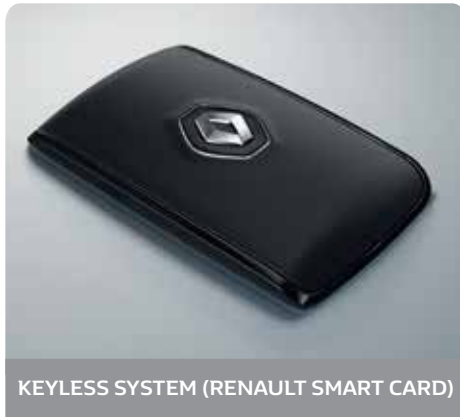
KEYLESS SYSTEM (RENAULT SMART CARD)