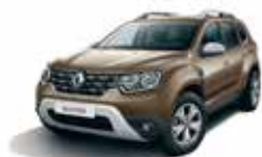
VISION BROWN (CNM)