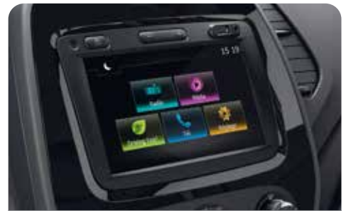
MEDIA NAV., & REAR CAMERA